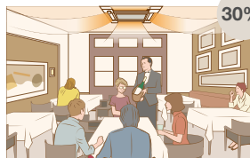
Pomieszczenie zajmowane częściowo