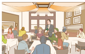
Pomieszczenia zajmowane w pełni