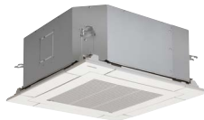
Jednostka kasetonowa 575x575 z panelem 620x620