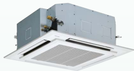
Jednostka kasetonowa 840x840 z panelem 950x950