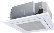
Jednostka kasetonowa Smart 840x840 z panelem 950x950