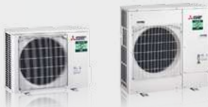
PUZ-ZM35 / 50VKA2